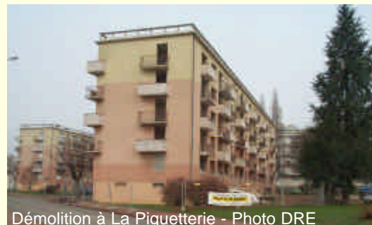
Démolition à La Piquetterie