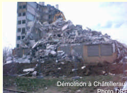
Démolition à Châtelleraut